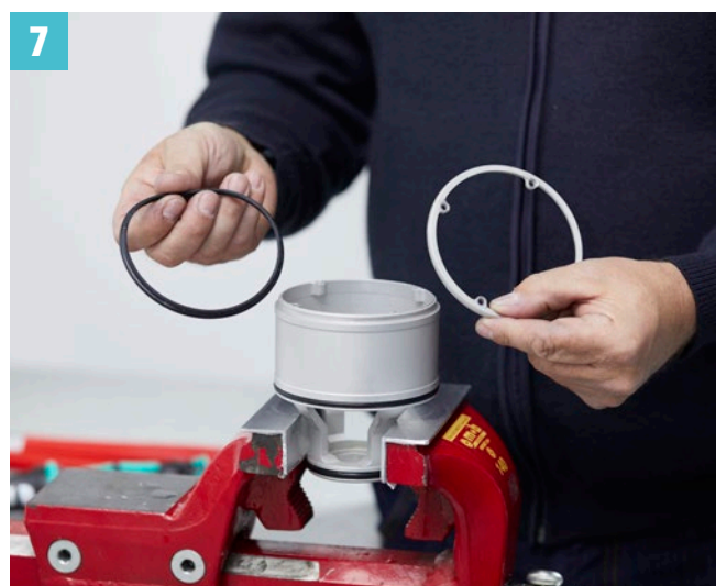
Formdichtung entfernen, neue einlegen und 4 Schrauben über Kreuz anziehen (Drehmoment 4 Nm)