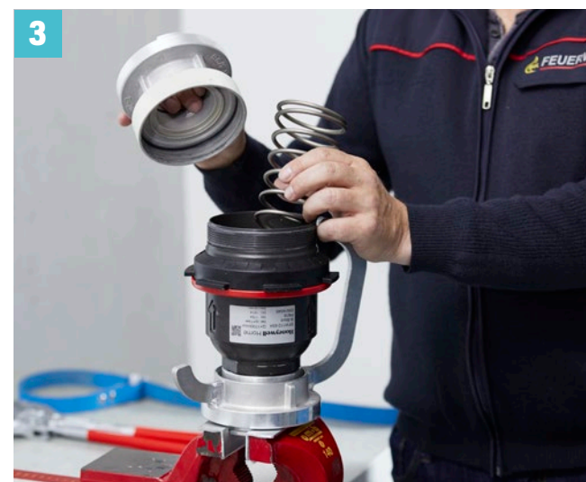
Spannungsfreie Feder entfernen