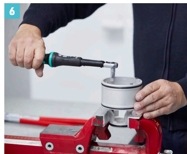
Kolben vorsichtig in Schraubstock einspannen und 4 Schrauben lösen