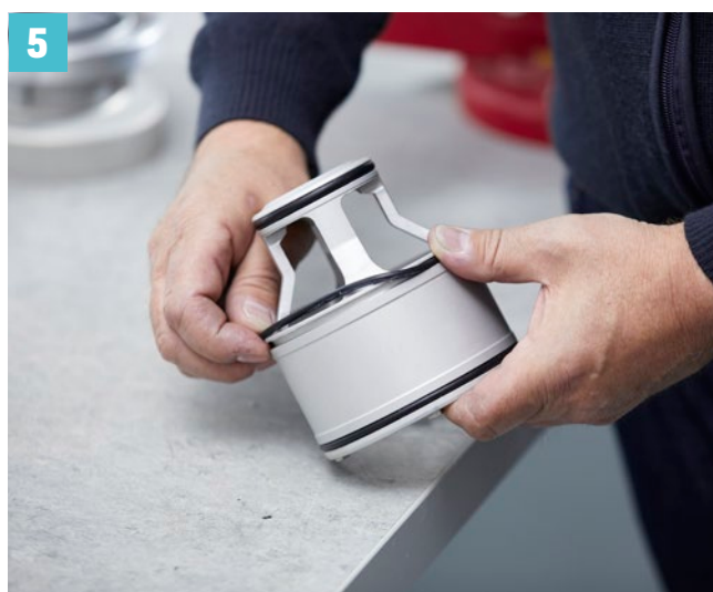
Neue O-Ringe montieren