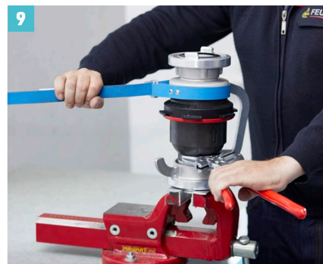
Deckel verschrauben und Systemtrenner mit TKA112 Prüfset testen