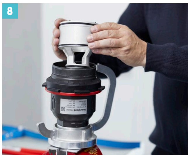
Kolben und Feder wieder einsetzen