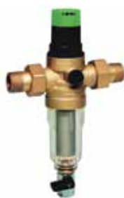
FK06 1/2" – 1 1/4" cserélhető betétes szűrőkombináció