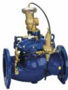
SV300 DN50 – DN450 biztonsági szelep