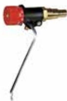
FR124 huzatszabályozó vegyes tüzelésű kazánokhoz