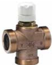
V135 1/2" – 1 1/4" DN15 – DN32 2-utú/3-járatú keverő- és osztószelep belső- és külső menetes változatban