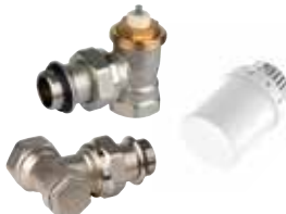
VTL3030ES15 termostikus radiátorselepek készlet, \frac{1}{2} ", belső menetes, gumigyűrűvel sarok (T3019W0 + V2030SX + V2430)