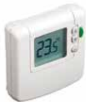
DT90/92 digitális vezetékes / vezeték nélküli helyiségtermostát