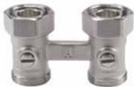
V2495 / 2496

előbeállítható radiátor csavarzat, gumigyűrűs csatlakozással, egyenes / sarok