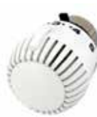
T7000 megerősített kivitelű termostikus fej, M30x1.5 csatlakozású radiátorselepekre