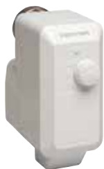
M6410 / 7410 szelepmozgató 230/24Vac, 3-pt/0-10V