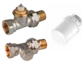
VTL3020DS15 termostikus radiátorselepek készlet, \frac{1}{2} ", belső menetes egyenes (T3019W0 + V2020SX + V2420)