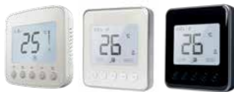
TF228 / TF428 digitális fan-coil termostát 2/4 csöves rendszerekhez 24/230V, 0...10V, MOD-BUS, BACnet