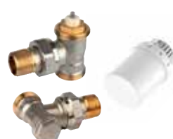
VTL3026ES15 termostikus radiátorselepek készlet, \frac{1}{2} ", külső menetes sarok (T3019 + V2026SX + V2427)