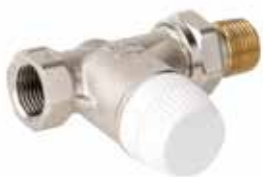
V2050A 1/2" – 1"

kis ellenállású termostatikus szelep, egyenes / sarok