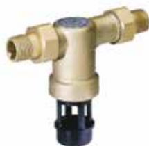
CA295 1/2" – 3/4" visszafolyásgátló, CA besorolás MSZ EN 1717