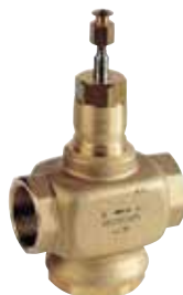
DI 1/2" – 2" 1-utú / 2-járatú szabályozó szelep belső menettel