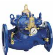
DH300 DN50 – DN450 primer oldali nyomástartó szelep