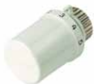
T3019 Thera-6 termostikus fej M30X1.5 és Danfoss csatlakozású radiátorselepekre