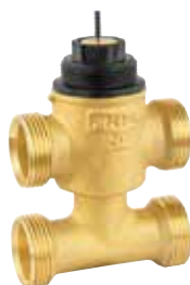
VYE 1/2" – 3/4" 2-utú / 3-járatú váltószelep bypass ággal