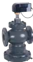
V5006TF DN50 – DN150 Kombi-QM, motorral szerelt nyomásfüggetlen térfogatáram szabályozó szelep