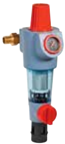
FK74CS 1/2" – 1 1/4" visszamosható szűrőkombináció, lakossági