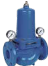
D15S DN65 – DN200 nyomákszabályozó szelep