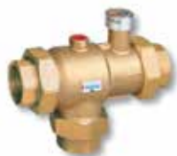
TM3400 / 3410 1/2" – 2" / DN65 – DN80 keverőszelep