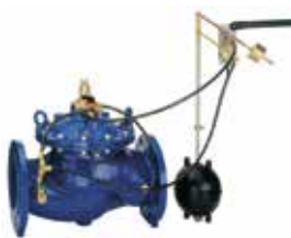
FV300 DN50 – DN450 úszós töltőszelep