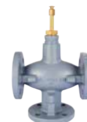
XF...A / B / XF...B / D DN15 – DN150 2-utú / 3-járatú szabályozó szelep