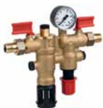
NK300S 1/2" rendszeröltő nyomáscsökkentővel és visszafolyásgátlóval