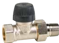
V2020LX 1/2" – 3/4"

kis ellenállású termostatikus szelep, egyenes / sarok