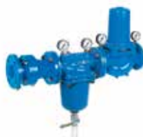
HS10S-FA DN65 – DN100 ivóvíz állomás