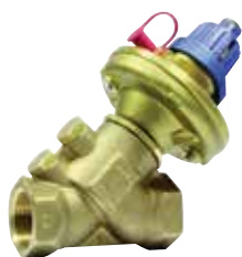
V5001P Kombi-Auto DN15 – DN50 nyomáskülönbség szabályozó szelep