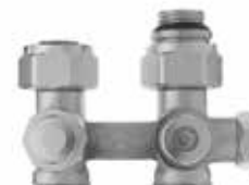
V2471 / 2461

előbeállítható radiátorszeleppel szerelt univerzális H-Blokk, egyenes és sarok kivitelben, design takaróelemmel