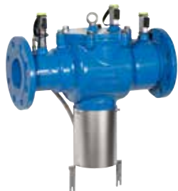
BA300 DN65 – DN200 visszafolyásgátló, BA besorolás MSZ EN 1717