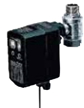
Z11AS öblítő automatika