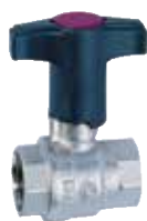
VB550 1/2" – 2" golyóscsap