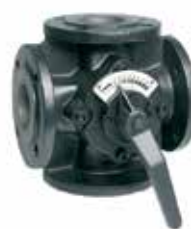
ZR...FA DN25 – DN200 4-járatú keverőcsap