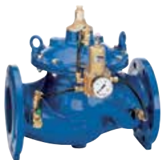
DR300 DN50 – DN450 nagy pontosságú nyomás szabályozó szelep