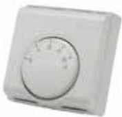
T6360 Vezetékes analóg termostát