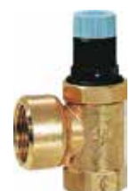
SM152.. biztonsági lefúvató-szelep