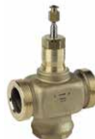
DE 1/2" – 2" 1-utú / 2-járatú szabályozó szelep külső menettel