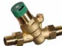
D05FT 1/2" – 2" nyomákszabályozó szelep melegvízes alkalmazáshoz