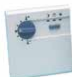
SDW10EE analog beltéri egység

szabályozók több funkcióval: • kazánindítás • kazánok léptetése • szivattyús kör • keverőszelepes kör • HMV vezérlés • szolár vezérlés • szabadon programozható kimenetek