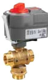
MVN mozgató motor VBG golyóscsapokhoz 230/24Vac, 3-pt/0-10V