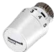
T5019 Thera-5 termostikus fej M30X1.5 és Danfoss csatlakozású radiátorselepekre