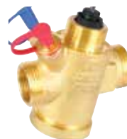
V5007 Kombi PICV 1/2" – 2" / DN15 – DN50 motorral szerelhető, nyomásfüggetlen térfogatáram szabályozó szelep