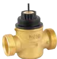
VDE 1/2" – 1" 1-utú / 2-járatú nyit / zár szelep