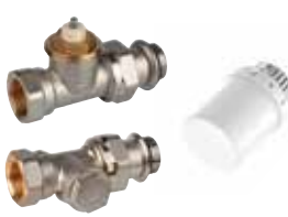
VTL3030DS15 termostikus radiátorselepek készlet, \frac{1}{2} ", belső menetes, gumigyűrűvel egyenes (T3019W0 + V2030SX + V2430)