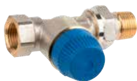
V2100 kombi trv \frac{3}{8} " – \frac{3}{4} " / DN 10 – 20 nyomásfüggetlen termostikus radiátorselep egyenes, sarok és axiális kivitelben