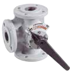
DR...GFLA DN20 – DN200 2-utú / 3-járatú keverőcsap