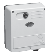
VMM / VRM keverőcsap és pillangószelep mozgató motorok 230/24Vac, 3-pt/0-10V