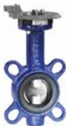
V5421B DN25 – DN200 motorral szerelhető pillangószelep