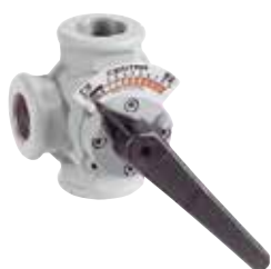
DR...GMLA 1/2" – 1 1/2" 2-utú / 3-járatú keverőcsap