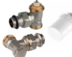
VTL3036ES15 termostikus radiátorselepek készlet, \frac{1}{2} ", külső menetes, gumigyűrűvel sarok (T3019 + V2036SX + V2437)