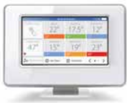
ATC928WIFI evohome vezeték nélküli RF központi egység 1–12 zónás rendszerekhez, internet eléréssel