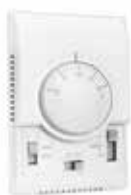
T6375 analóg fan-coil termostát 2/4 csöves rendszerekhez