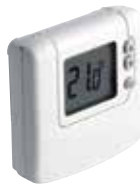
DTS92 vezeték nélküli helyiség hőmérséklet érzékelő evohome rendszerhez