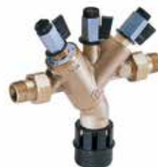
BA295S 1/2" – 2" visszafolyásgátló, BA besorolás MSZ EN 1717