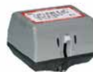
VC4013 / VC4613 működtető motor VC szelepekhez 230Vac, 2pt