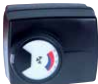
M6063 mozgató motor kompakt keverőcsapokhoz 230/24Vac, 3-pt