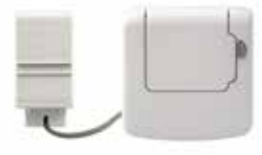
ATF500DHW HMV tartály hőmérséklet érzékelő készlet evohome rendszerhez