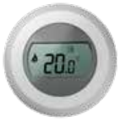
T87RF vezeték nélküli helyiség hőmérséklet érzékelő evohome rendszerhez