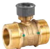
VBG2 DN15 – 50 1-utú szabályozó golyóscsap