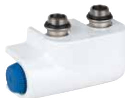
VTL2174 \frac{1}{2} " előbeállítható nyomásfüggetlen radiátorseleppel szerelt univerzális H-Blokk, egyenes és sarok kivitelben, design takaróelemmel