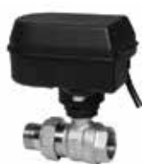
HAV 3/4" – 1 1/4" motoros golyóscsap, 230Vac, 2pt