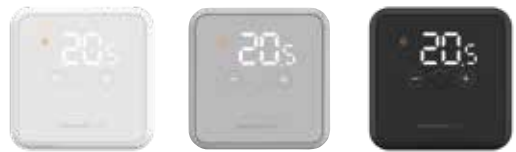
DT4, DT4R, DT4M vezetékes/vezeték nélküli/OpenTherm önálló termostátok vagy HCC100 és evohome zónaszabályozó rendszerekhez használható helyiség hőmérséklet érzékelők