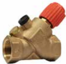
V5001S Kombi-S 1/2" – 2" strangszabályozó és elzáró szelep