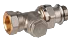
V2430 3/8" – 1/2"

előbeállítható radiátor csavarzat, eurokónuszos csatlakozással, egyenes / sarok