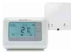
T4/T4R programozható digitális vezetékes / vezeték nélküli helyiségtermostát