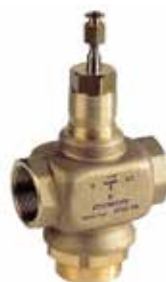
XI 1/2" – 2" 2-utú / 3-járatú szabályozó szelep belső menettel