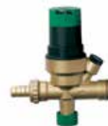
VF06 1/2" rendszeröltő szelep nyomáscsökkentővel