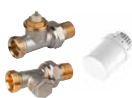
VTL3026DS15 termostikus radiátorselepek készlet, \frac{1}{2} ", külső menetes egyenes (T3019 + V2026SX + V2427)