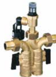
SG160S / SD 1/2" – 1" biztonsági szerelvénycsoport