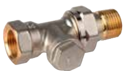
V2420 Verafix-E 3/8" – 3/4"

előbeállítható radiátor csavarzat, egyenes / sarok