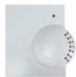
HCF82 vezeték nélküli helyiség hőmérséklet érzékelő evohome rendszerhez, kijelző nélkül