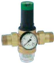
D06F 1/2" – 2" nyomákszabályozó szelep