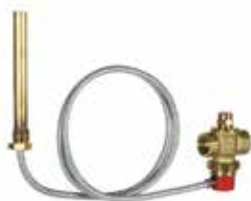
TS131 3/4" termikus elfolyó biztonsági szelep