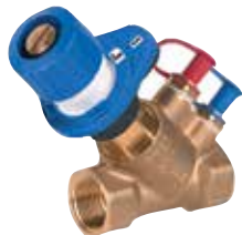
V5032Y Kombi-2-plus 1/2" – 3" előbeállítható strangszabályozó szelep mérőcsonkkal