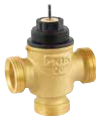
VXE 1/2" – 1" 2-utú / 3-járatú keverőszelep