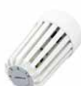
T100VM vandálbiztos termostikus fej, M30x1.5 csatlakozású radiátorselepekre