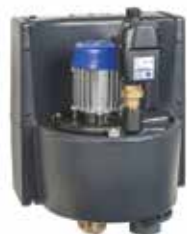
CBU140 / 146 megszakítótartályos visszafolyásgátló, AB besorolás MSZ EN 1717