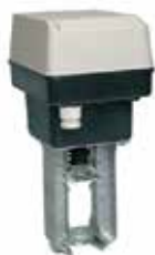
ML6420 / 7420 szelepmozgató 230/24Vac, 3-pt/0-10V