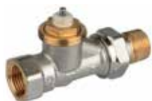
V2020SX 3/8" – 3/4"

termostatikus szelep, egyenes / sarok / axiális / térsarok