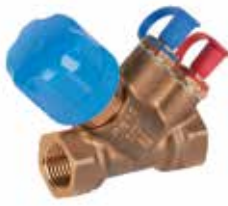
V5032LF Kombi-2-plus 1/2" előbeállítható strangszabályozó szelep mérőcsonkkal