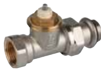
V2030SX 3/8" – 1/2"

termostatikus szelep, egyenes / sarok / axiális