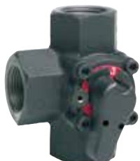
V5433A 3/4" – 2" 2-utú / 3-járatú kompakt keverőcsap