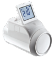
HR92EE elektronikus radiátor szabályozó kijelzővel, rádiófrekvenciás