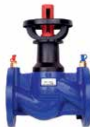
V6000 Kombi-F DN15 – DN400 előbeállítható strangszabályozó szelep mérőcsonkkal