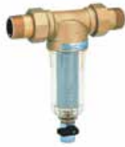
FF06 1/2" – 1 1/4" cserélhető betétes finomszűrő