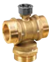
VBG3 DN15 – 50 2-utú szabályozó golyóscsap