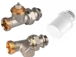
VTL3036DS15 termostikus radiátorselepek készlet, \frac{1}{2} ", külső menetes, gumigyűrűvel egyenes (T3019 + V2036SX + V2437)