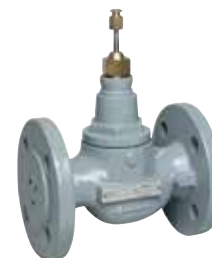
DF..B...CI DN15 – DN150 1-utú / 2-járatú szabályozó szelep