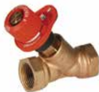
V1810.. 1/2" – 6/4" cirkulációs beszabályozó szelep