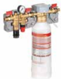
NK300SE-SO 1/2" rendszeröltő vízlágyító vagy sótalanító tartállyal