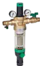
HS10S 1/2" – 2" házi ivóvízállomás