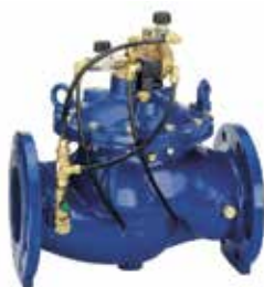
MV300 DN50 – DN450 mágnesszeleppel vezérelt elzárószelep