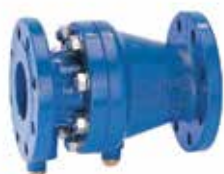
RV283S DN40 – DN300 visszafolyásgátló, EA besorolás MSZ EN 1717