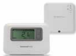
T3/T3R programozható digitális vezetékes / vezeték nélküli helyiségtermostát