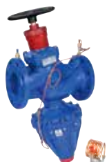
V7000 DN65 – DN150 Karimás nyomáskülönbség szabályozó szelep