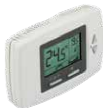
T6590 digitális fan-coil termostát LCD kijelzővel 2/4 csöves rendszerekhez