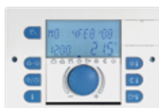
SMILE-3 10WM SMILE-3 40WM SMILE-7 21WM SMILE-9 21WM SMILE-12 31WM

szabályozók több funkcióval: • kazánindítás • kazánok léptetése • szivattyús kör • keverőszelepes kör • HMV vezérlés • szolár vezérlés • szabadon programozható kimenetek