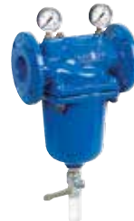
F78TS-F DN65 – DN125 visszamosható vívízszűrő