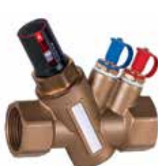
V5003FY Kombi-VX 1/2" – 2" nyomásfüggetlen térfogatáram szabályozó szelep