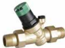
D05FS 1/2" – 2" nyomákszabályozó szelep beállítókálával