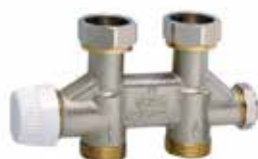
V2464 / 2474 1/2" – 3/4"

csavarzat, egyenes / sarok, 1/2" belső vagy 3/4" külső menetes radiátorhoz, kétcsöves rendszerhez