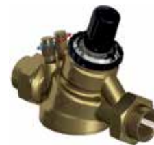
V5006T Kombi-QM 1/2" – 2 1/2" / DN50 – DN150 motorral szerelhető, nyomásfüggetlen térfogatáram szabályozó szelep