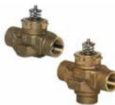
VCZA / VCZM 1/2" – 1" motoros szelep 1-utú / 2-járatú vagy 2-utú / 3-járatú