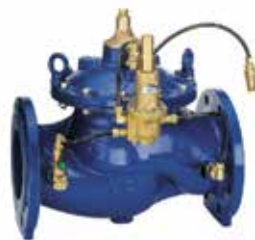
VR300 DN50 – DN450 térfogatáram szabályozó szelep