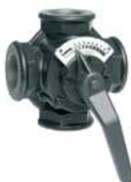
ZR...MA 1/2" – 1 1/2" 4-járatú keverőcsap