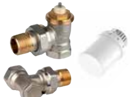
VTL3020ES15 termostikus radiátorselepek készlet, \frac{1}{2} ", belső menetes sarok (T3019W0 + V2020SX + V2420)