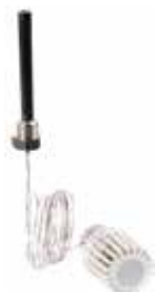
T100R termikus mozgató V135 szelephez