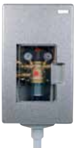
DWC7000 PrimusCenter házi vízfogadó állomás