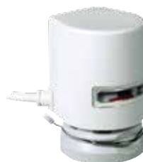
MT4 230/24Vac – 2pt termoelektromos működtető