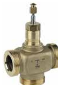
XE 1/2" – 2" 2-utú / 3-járatú szabályozó szelep külső menettel